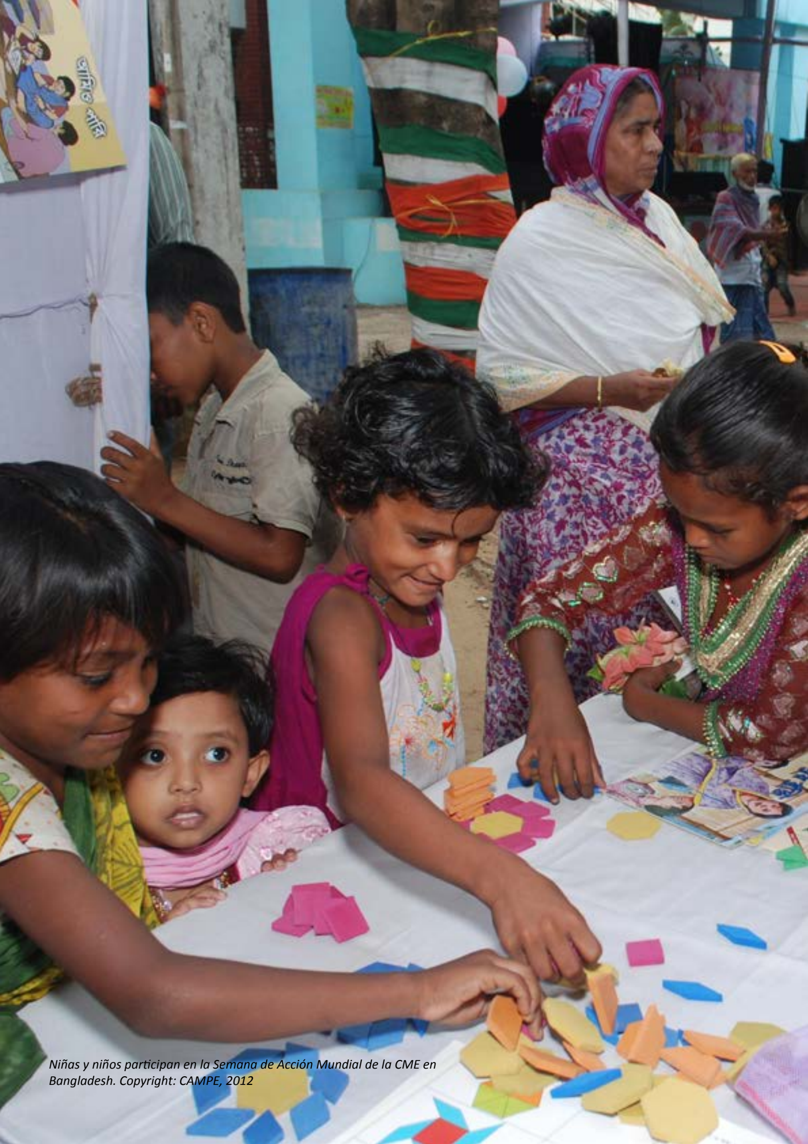
Niñas y niños participan en la Semana de Acción Mundial de la CME en Bangladesh.